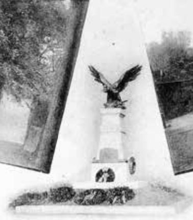
Denkmal für die bei Dölitz gefallenen Oesterreicher