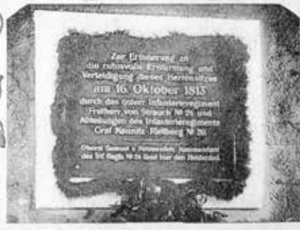
Gedenktafel im Durchgang