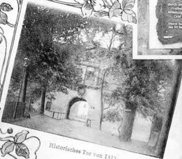
Historisches Tor von 1813